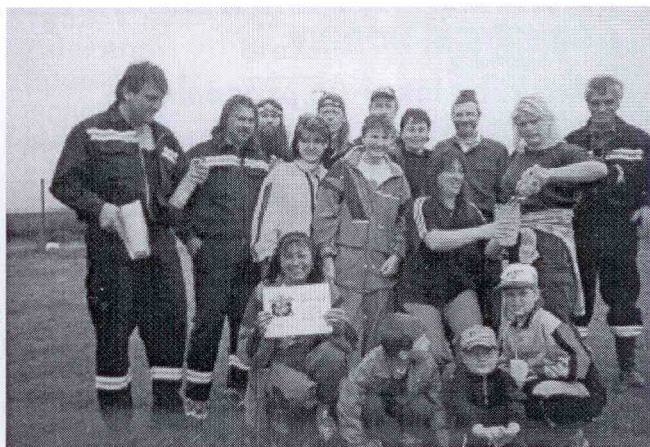
Foto: Naše družstva žen

Závěrem bychom chtěli poděkovat všem hráčům i hráčkám, že ani v tak nepříznivém počasí neztráceli chuť bojovat a podávali skvělé výkony. Také všem rozhodčím a divákům za podporu a pěknou atmosféru. Ten největší dík však patří těm, co se postarali o to, že jsme se tu mohli sejít a připravili občerstvení, bez kterého by jsme se myslíme nikdo z nás neobešel.