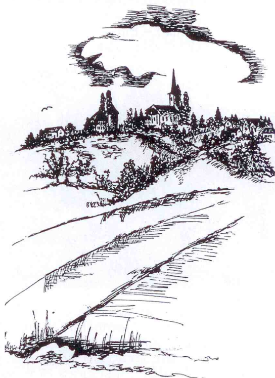
Kresba Světlana Žalmánková

SOKOLOVNA – každý pátek DISCO, každou sobotu HUDBA 70. a 80.let.