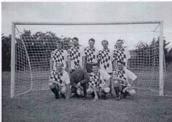
Vítězné družstvo mužů z Víšky