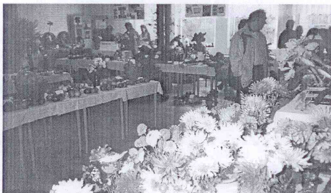
Foto z letošního ročníku výstavy

První místo získala MŠ Březinka, obdržela 25 čokolád a jablka. Na druhém místě se umístila MŠ Katusice, obdržela 25 lízátek a vystavené ovoce.